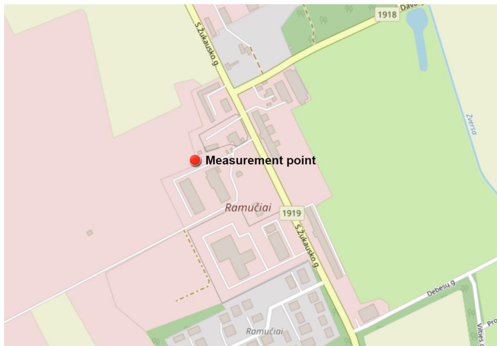
4 paveikslas. Matavimų vieta (Measurement point)