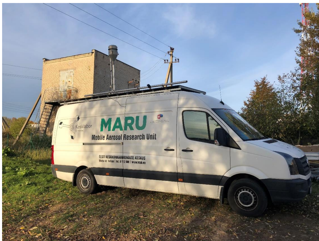
1 paveikslas. Mobilioji transporto priemonė ir tyrimo vieta

UAB Kauno kogeneracinė jėgainė užsakė 24 valandų trukmės aplinkos oro kokybės vertinimo ir stebėjimo tyrimą Ramučiuose, Kauno raj. Tyrimas atliktas 2018 10 08 – 2018 10 09 dienomis. Matavimai atlikti ir oro kokybė įvertinta vietoje, kurios koordinatės – 54°56'27.5"N; 24°02'17.4"E (žr. 1 ir 4 paveikslus). Matavimo rezultatai surinkti siekiant nustatyti oro teršalų koncentracijos dydį aplinkos ore bei įvertinti toliau pateiktų teršalų kiekį: vandenilio chlorido (HCl), vandenilio fluorida (HF), amoniako (NH 3 ), benzo(a)pireno (B(a)P) ir dioksinų (PCDD) ir furanų (PCDFs). Taip pat tyrimo metu atlikti vietos meteorologinių parametru matavimai.