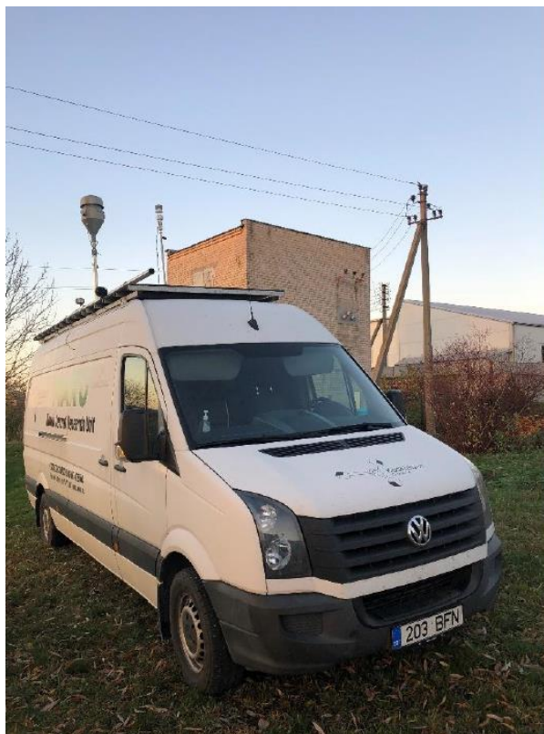
3 paveikslas. Mobilioji transporto priemonė ir tyrimo vieta