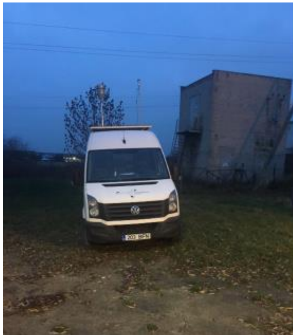
3 paveikslas. Mobilioji transporto priemonė ir tyrimo vieta