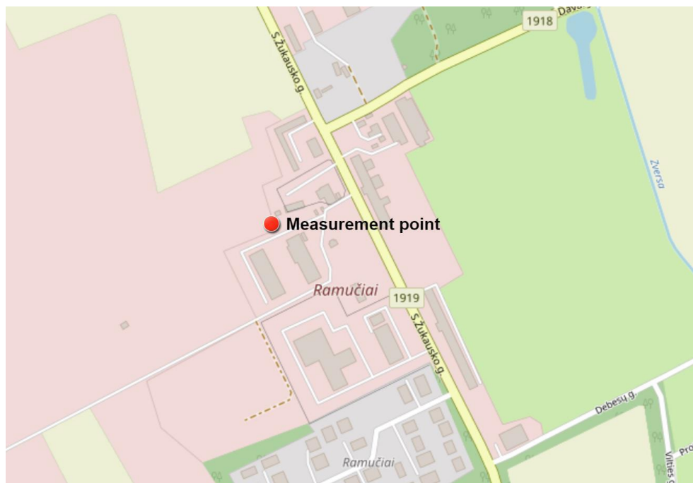
4 paveikslas. Matavimų vieta (Measurement point)