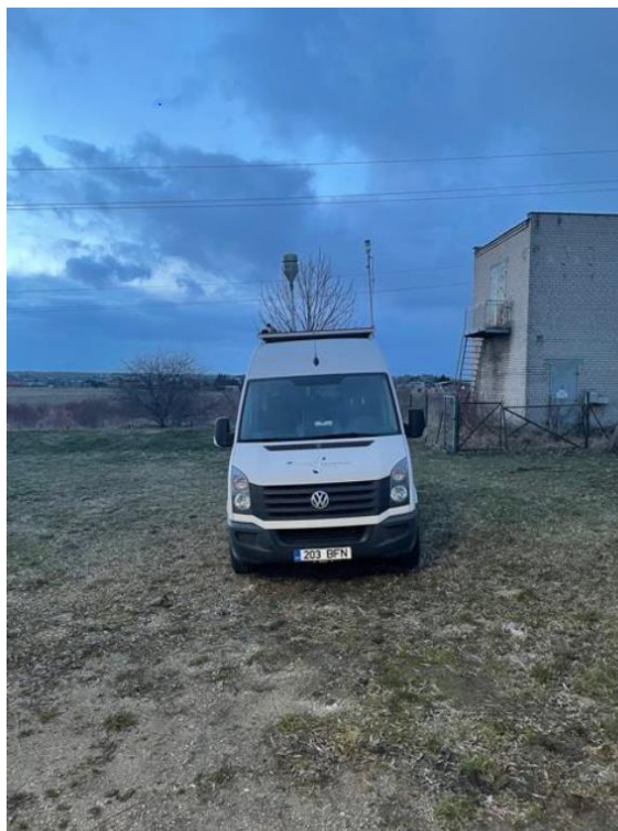
3 paveikslas. Mobilioji transporto priemonė ir tyrimo vieta