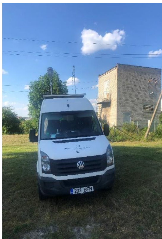
1 paveikslas. Mobilioji transporto priemonė ir tyrimo vieta

UAB Kauno kogeneracinė jėgainė užsakė 24 valandų trukmės aplinkos oro kokybės vertinimo ir stebėjimo tyrimą Ramučiuose, Kauno raj. Tyrimas atliktas 2020 08 17 – 2020 08 18 dienomis. Matavimai atlikti ir oro kokybė įvertinta vietoje, kurios koordinatės – 54°56'27.5"N; 24°02'17.4"E (žr. 1 ir 4 paveikslus). Matavimo rezultatai surinkti siekiant nustatyti oro teršalų koncentracijos dydį aplinkos ore bei įvertinti toliau pateiktų teršalų kiekį: vandenilio chlorido (HCl), vandenilio fluorida (HF), amoniako (NH 3 ), benzo(a)pireno (B(a)P) ir dioksinų (PCDD) ir furanų (PCDFs). Taip pat tyrimo metu atlikti vietos meteorologinių parametru matavimai.