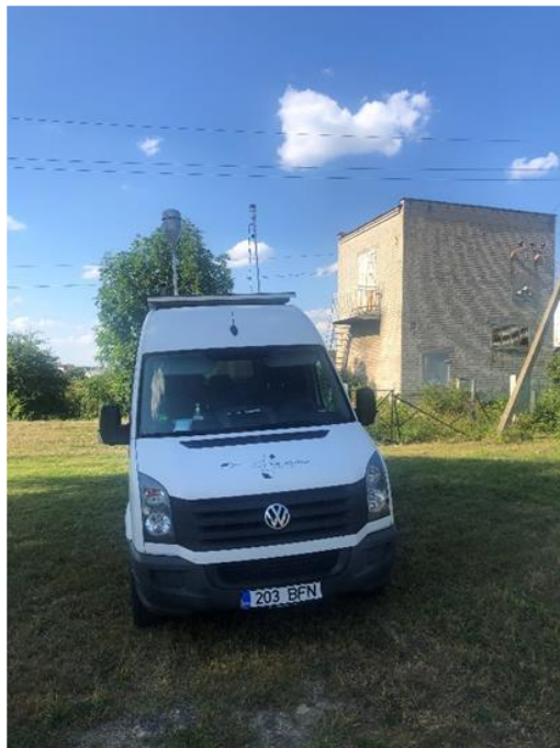
3 paveikslas. Mobilioji transporto priemonė ir tyrimo vieta