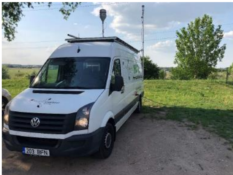
3 paveikslas. Mobilioji transporto priemonė ir tyrimo vieta