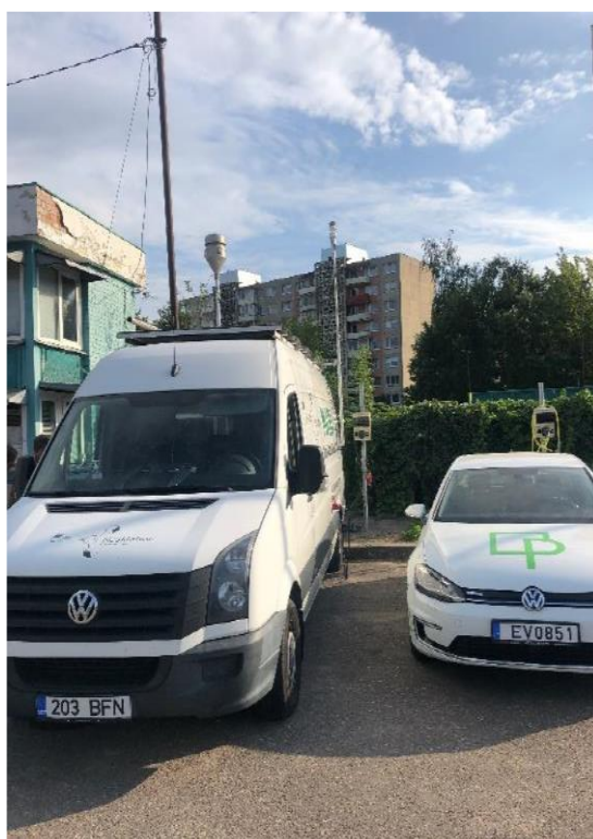
1 paveikslas. Mobilioji transporto priemonė ir tyrimo vieta

UAB Kauno kogeneracinė jėgainė užsakė 24 valandų trukmės aplinkos oro kokybės vertinimo ir stebėjimo tyrimą Kauno m. Partizanų g. 79. Tyrimas atliktas 2020 08 18 – 2020 08 19 dienomis. Matavimai atlikti ir oro kokybė įvertinta vietoje, kurios koordinatės – 54°55'47.3"N; 23°59'45.2"E (žr. 1 ir 2 paveikslus). Matavimo rezultatai surinkti siekiant nustatyti oro teršalų koncentracijos dydį aplinkos ore bei įvertinti toliau pateiktų teršalų kiekį: vandenilio chlorido (HCl), vandenilio fluorida (HF), amoniako (NH 3 ), benzo(a)pireno (B(a)P) ir dioksinų (PCDDs) ir furanų (PCDFs). Taip pat tyrimo metu atlikti vietos meteorologinių parametrų matavimai.