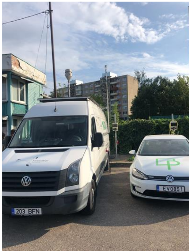
3 paveikslas. Mobilioji transporto priemonė ir tyrimo vieta